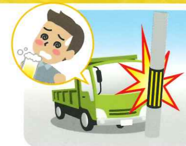
飲酒を伴う交通事故の実態(過去5年間)

飲酒運転は悪質な犯罪であるとの認識をしっかりと持ち、二日酔いを含めた飲酒運転の根絶を目指しましょう。「捕まらなければ大丈夫だ」という間違った考えをしていませんか? 「飲酒したら運転しない」、「運転する人には飲ませない」を徹底しましょう。